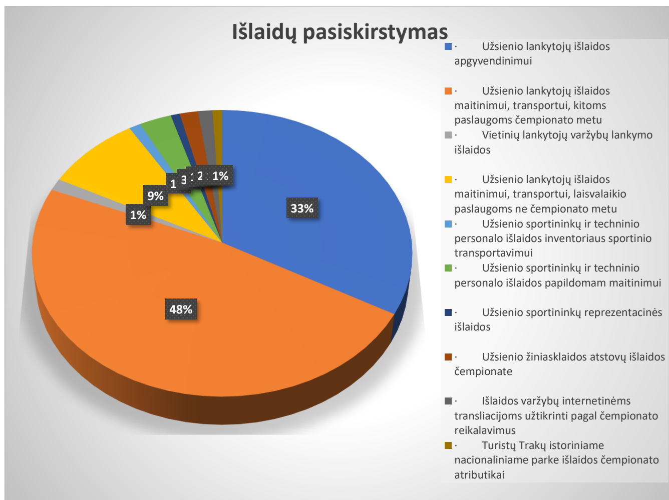
Pav. 1: . Išlaidų paskirstymas pagal atskirus ekonominio vertinimo rodiklius